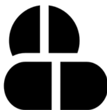
食品サプリメント