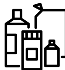
BIOCYDY I DETERGENTY I TOWARY NIEBEZPIECZNE

BIURA: MEDIOLAN-GENUA-RZYM (WŁOCHY) & 8 INTERNATIONAL COOPERATIVE OFFICES