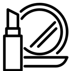
КОСМЕТИКА И УХОД ЗА ТЕЛОМ