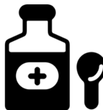
ФАРМАЦЕВТИЧЕСКАЯ ПРОДУКЦИЯ И МЕДИЦИНСКИЕ ИЗДЕЛИЯ