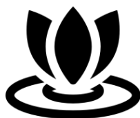
SPA Y WELLNESS